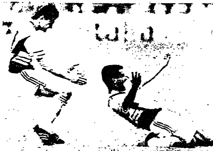
اليوغوسلافي يوزيتش يحتفل بعد تسجيله هدف لفرقة (رويتش)